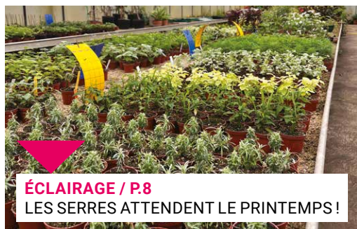
ÉCLAIRAGE / P.8 LES SERRES ATTENDENT LE PRINTEMPS !