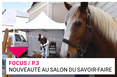
FOCUS / P.3 NOUVEAUTÉ AU SALON DU SAVOIR-FAIRE