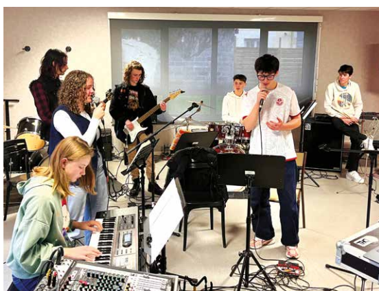
Slobber, groupe de l'atelier de musiques actuelles formé de jeunes de 13 à 18 ans, répètent leur composition pour le concert du 14 mars avec The Orchid.