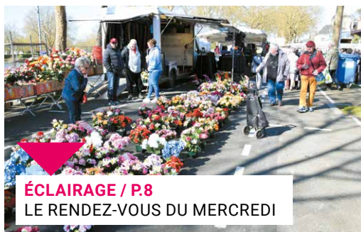
ÉCLAIRAGE / P.8 LE RENDEZ-VOUS DU MERCREDI