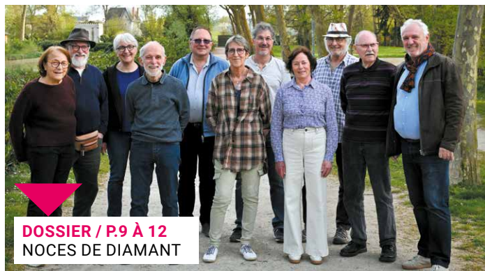
DOSSIER / P.9 À 12 NOCES DE DIAMANT

FOCUS / P.3: À PORTÉE DE REGARD - ACTUALITÉS / P.4 À 7: LA SAISON EST LANCÉE > P.4 - UN LOGEMENT POUR TOUS > P.7 - ÉCLAIRAGE / P.8: LE RENDEZ-VOUS DU MERCREDI - DOSSIER / P.9 À 12: NOCES DE DIAMANT - PORTRAIT / P.13: NATHAN QUARTIER - LOISIRS / P.14 À P.17: EN MODE VACANCES > P.14 - VEILLÉE DES SAINTS DE GLACE > P.15 - TRIBUNES / P.18 - INFOS PRATIQUES / P.19