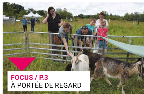
FOCUS / P.3 À PORTÉE DE REGARD