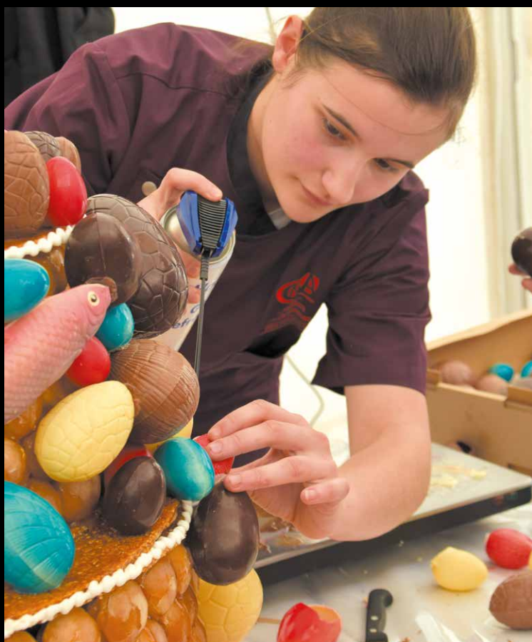
▲ 28-29 MARS Le Salon du savoir-faire du Pays fléchois , un rendez-vous pour réfléchir à son projet professionnel.