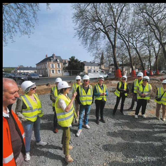
▲ 5 AVRIL En compagnie de la maire, les visites de chantier de Port-Luneau ont fait le plein.