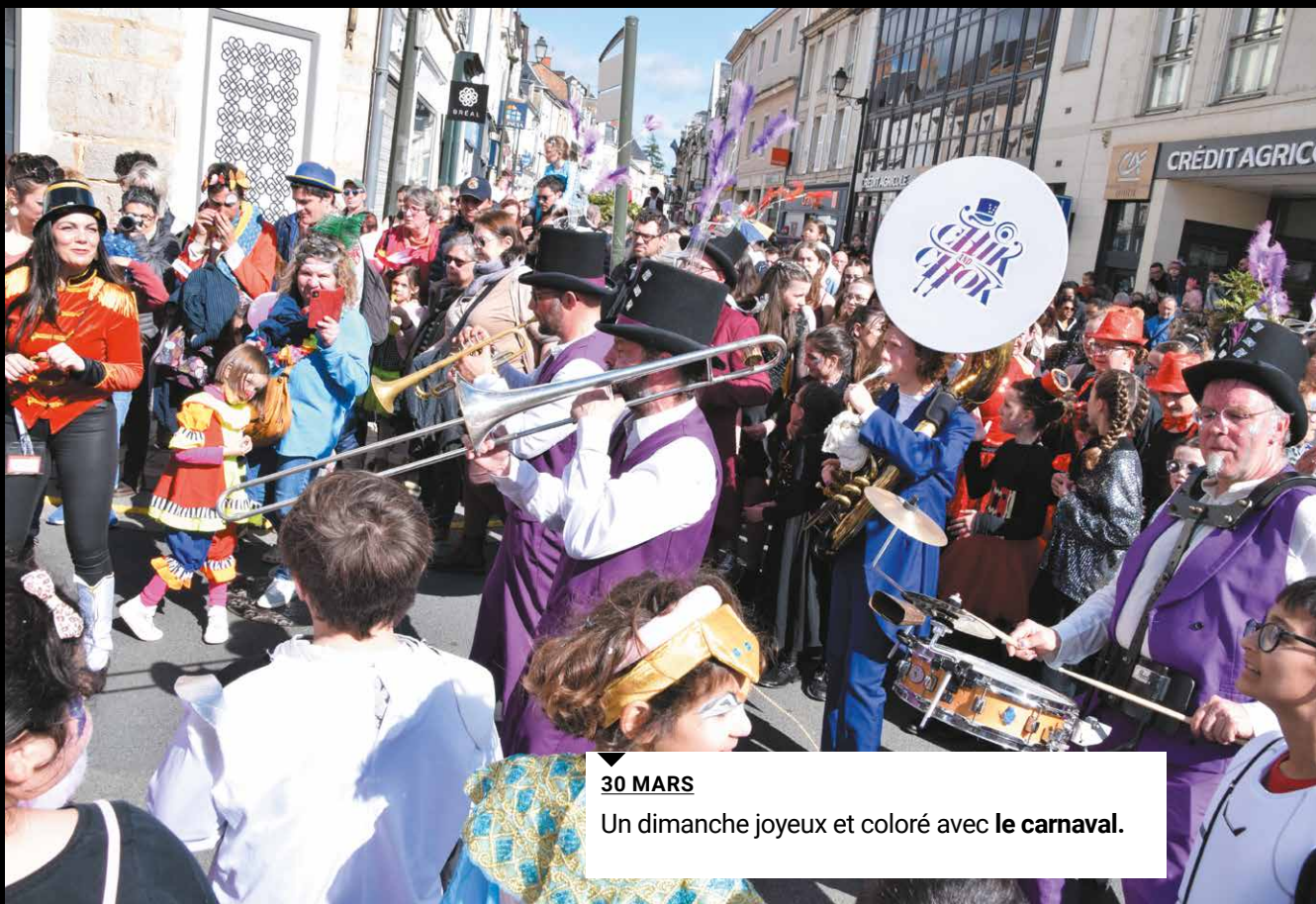
▼ 30 MARS Un dimanche joyeux et coloré avec le carnaval .

▼ PARTAGEZ VOS PLUS BELLES PHOTOS DE LA FLÈCHE SUR INSTAGRAM 📷 AVEC #LAFLECHE