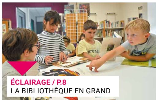
ÉCLAIRAGE / P.8 LA BIBLIOTHÈQUE EN GRAND