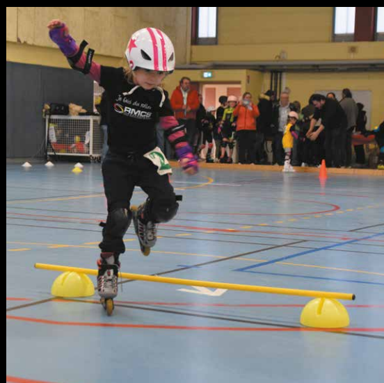
▲ 8 FÉVRIER 74 jeunes Sarthois ont participé à la 4 e étape du Kid's roller au gymnase du Petit-Versailles.