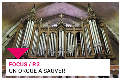
FOCUS / P.3 UN ORGUE À SAUVER