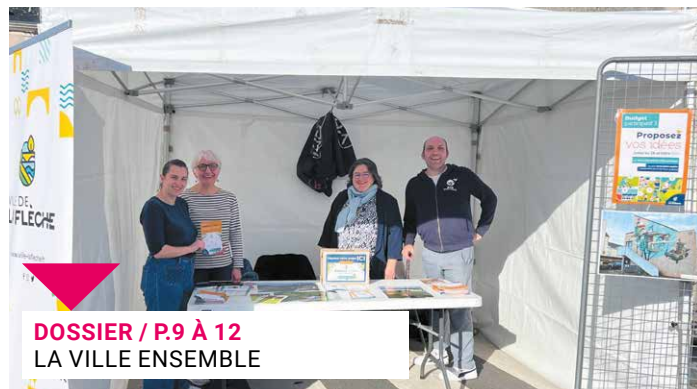
DOSSIER / P.9 À 12 LA VILLE ENSEMBLE

FOCUS / P.3 : UN ORGUE À SAUVER - ACTUALITÉS / P.4 À 7 : DES SAVOIR-FAIRE À DÉCOUVRIR > P.4 - UNE MINE D'OR > P.7 - ÉCLAIRAGE / P.8 : LA BIBLIOTHÈQUE EN GRAND - DOSSIER / P.9 À 12 : LA VILLE ENSEMBLE - PORTRAIT / P.13 : JIPÉ - LOISIRS / P.14 À P.17 : JEU DE MOTS > P.14 - LE FESTIVAL DES CINÉMAS AFRICAINS A 10 ANS > P.15 - TRIBUNES / P.18 - INFOS PRATIQUES / P.19