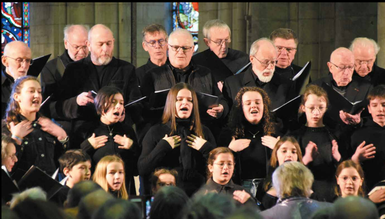
24 FÉVRIER Concerts professionnels et amateurs pour La Folle Journée de Nantes à La Flèche.

▼ PARTAGEZ VOS PLUS BELLES PHOTOS DE LA FLÈCHE SUR INSTAGRAM 📷 AVEC #LAFLECHE