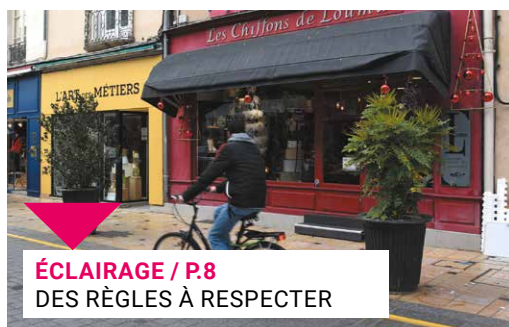
ÉCLAIRAGE / P.8 DES RÈGLES À RESPECTER