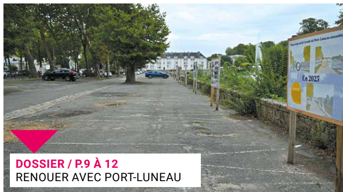
DOSSIER / P.9 À 12 RENOUER AVEC PORT-LUNEAU

FOCUS / P.3: UN PONT ENTRE DEUX VILLES - ACTUALITÉS / P.4 À 7: CRÉER DU LIEN > P.4 - UN LABEL CAPITAL > P.7 - ÉCLAIRAGE / P.8: DES RÈGLES À RESPECTER - DOSSIER / P.9 À 12: RENOUER AVEC PORT-LUNEAU - PORTRAIT / P.13: NICOLAS ROYER - LOISIRS / P.14 À P.17: UN TEMPS POUR S'AMUSER > P.14 - OCTOBRE ROSE > P.15 - TRIBUNES / P.18 - INFOS PRATIQUES / P.19