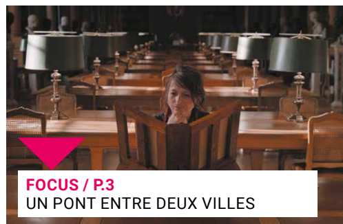
FOCUS / P.3 UN PONT ENTRE DEUX VILLES