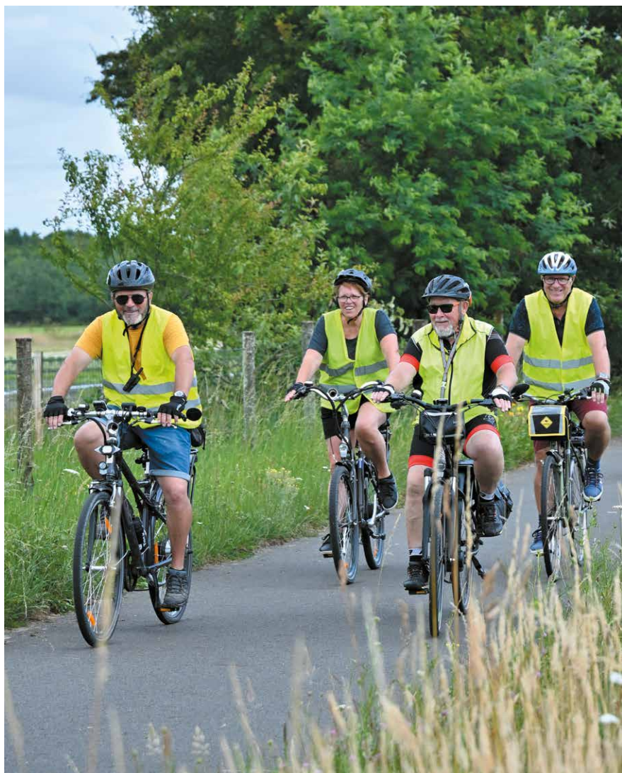
Le nouveau programme du pôle seniors sera disponible à partir du 11 septembre.