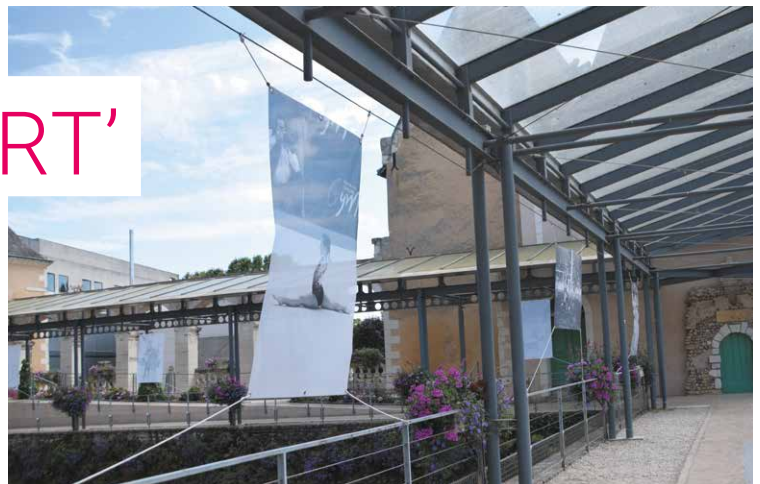
Tout l'été, Photo sArt' a proposé une exposition sur le thème du sport, devant la mairie.

▼ PLUS D'INFORMATIONS SUR LA PAGE FACEBOOK DE L'ASSOCIATION.