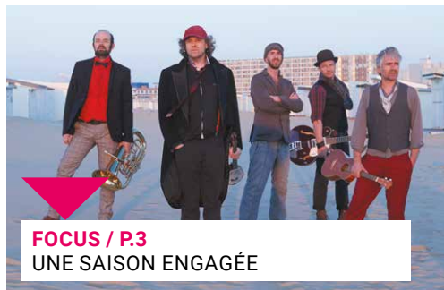
FOCUS / P.3 UNE SAISON ENGAGÉE