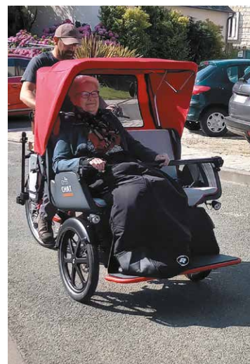
Des balades en triporteur sont organisées.

des Seniors sportifs du Pays fléchois et des groupes Générations mouvement de Verron et Saint-Germain. La bibliothèque municipale, accessible par le patio, proposera en outre une sélection d'ouvrages, y compris en grands caractères. Enfin, un spectacle intitulé Aidez-moi, un peu, beaucoup, pas trop , évoquera les différentes étapes du vieillissement sur la scène de Coppélia. ◀