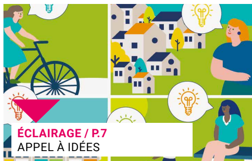
ÉCLAIRAGE / P.7 APPEL À IDÉES