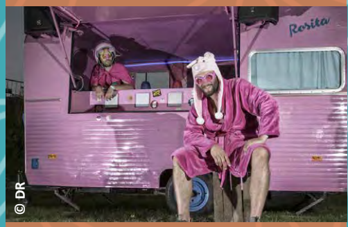
ET SI ON CHANTAIT LA CHARCUTERIE MUSICALE