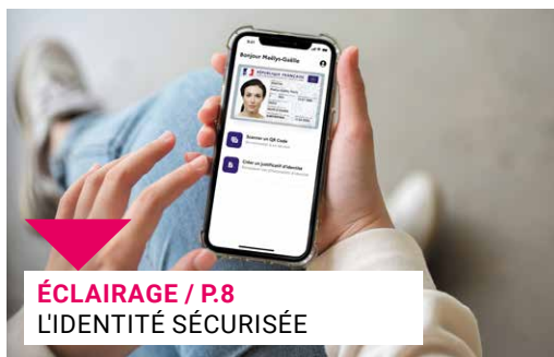
ÉCLAIRAGE / P.8 L'IDENTITÉ SÉCURISÉE