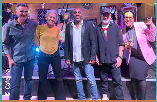
EN SALSA ME ! CAFEINA