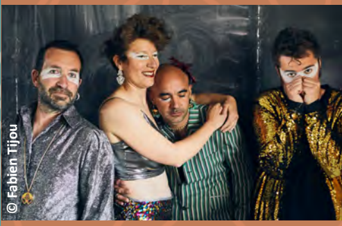
DES LIONS POUR DES LIONS ALPHA CENTAURI