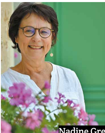
Nadine Grelet Certenais, maire de La Flèche