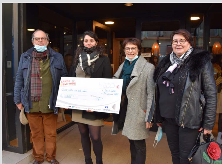
Kraft Déco, boutique de décoration située 50 Grande Rue, a remporté le premier prix du concours Lance ta boutique.

Si la professionnelle évoque des phases similaires « tous les deux ou trois ans », elle se félicite néanmoins de la période « très dynamique dont profite La Flèche et son centre-ville ». D'autant que la périphérie n'est pas en reste avec l'installation prochaine de nouvelles enseignes à La Monnerie. « On le voit, l'architecture de La Flèche et le style des boutiques attirent les nouveaux venus qui n'hésitent pas à s'entourer de professionnels locaux pour l'aménagement de leur magasin », ajoute la directrice. Un cercle vertueux pour l'économie locale.