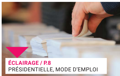
ÉCLAIRAGE / P.8 PRÉSIDENTIELLE, MODE D'EMPLOI