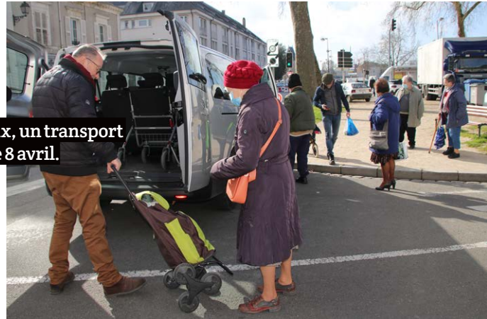
Le chauffeur dépose et reprend ses passagers à proximité du marché.

Fort du succès de ce service, le pôle seniors envisage aujourd'hui de proposer un transport vers les supermarchés fléchois. « Pour cela il