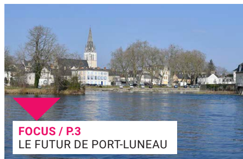
FOCUS / P.3 LE FUTUR DE PORT-LUNEAU